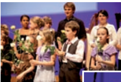
Landeshauptmann Dr. Erwin Pröll gratulierte den kleinen Musikern.