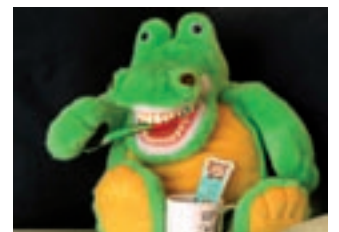
Das Zahnputzmaskottchen „Kroko“