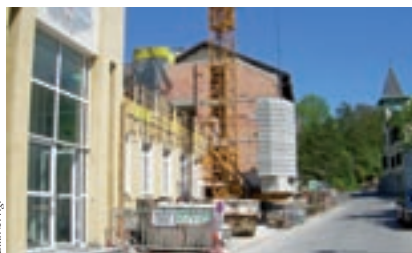
Dieses Bild von den Umbauarbeiten bot sich den Passanten im April.

Die Arbeiten konzentrieren sich derzeit auf die Hanak-Halle: Sanierung der Halle, Erweiterung der Ausstellungs-