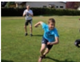
Sportunterricht in englischer Sprache.