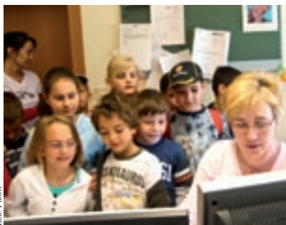
Klasse 3a in der Buchhaltung

Am 22., 27. und 29. April besuchten die 3. Klassen unserer Volksschule das Gemeindeamt. Jedes Jahr sind wir gespannt auf die Fragen und Anliegen, die von unseren jungen BürgerInnen vorgebracht werden. Im Festsaal, den viele Kinder schon von den zahlreichen Veranstaltungen oder Auftritten mit der Musikschule kennen, beginnen wir meist unseren Rundgang. Es ist erstaunlich, wie gut informiert die SchülerInnen über Organisation und Aufgaben der Gemeindeverwaltung sind. Die 3a hat zu diesem Thema ein bunt gestaltetes Plakat mitgebracht, über welches sich unser Herr Bürgermeister sehr gefreut hat. Im Alltag ergeben sich viele Anknüpfungspunkte mit der Gemeindeverwaltung und es zeigt sich, dass die Kinder zu Hause sehr viel darüber erfahren. In der Schule werden die in der Praxis gesammelten Erfahrungen vertieft und ergänzt. All dies trägt dazu bei, dass unsere jungen BürgerInnen ein Naheverhältnis zu ihrer Heimatgemeinde aufbauen. Die SchülerInnen der 3b waren sich zwar nicht ganz sicher, ob sie einmal selbst das Amt des Bürgermeisters anstreben wollen. Die 3c bereitete uns dadurch Freude, dass sie sich überlegt hat, was ihr an Langenzersdorf besonders gefällt. Nach einem Besuch des Bauamtes, der Buchhaltung und des Bürgerservices stärkten sich alle bei einer Jause. Wir hoffen, den SchülerInnen hat es gefallen und freuen uns schon auf den Besuch der nächsten Klassen im kommenden Jahr.