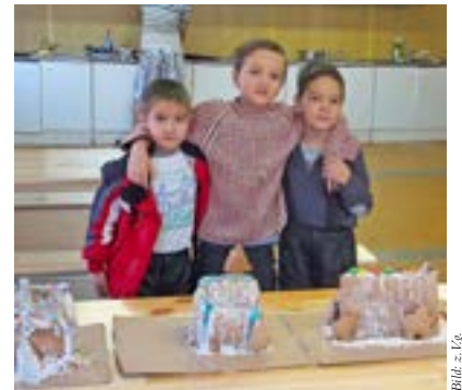
Bilder z. Kög.

Die Häuser haben die SchülerInnen selbst geplant, gebacken, zusammengesetzt und liebevoll verziert. Die Kinder im Containerdorf waren sichtlich begeistert von der süßen Spende aus der NNÖMS Langenzersdorf!