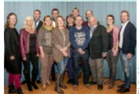
Die Jury, bestehend aus Vertretern der Politik, der Verwaltung, BürgerInnen und Architekten.