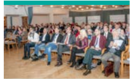
An die 200 interessierte Zuhörer folgten den Präsentationen der vier Architektenteams.