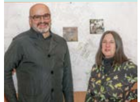
Das Siegerteam: die Architektengruppe POLAR.