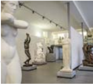
Raumansicht Anton Hanak

Führungsbeitrag: € 2,- zzgl. Museumseintritt/NÖ-CARD