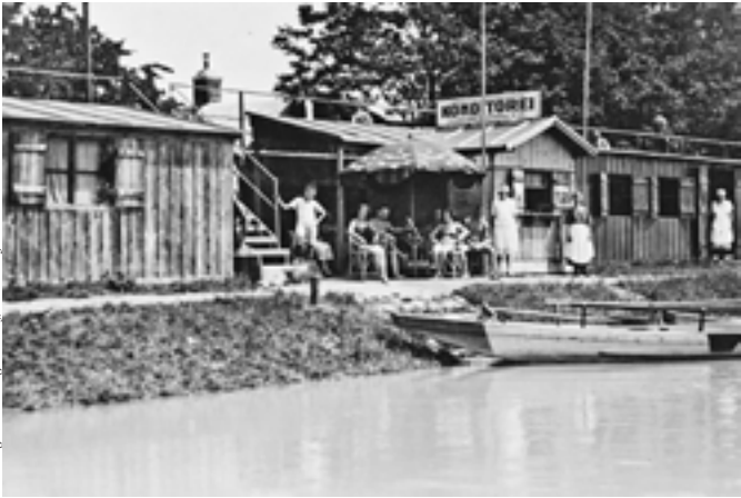
Bootsverleih und Donau-Überfuhr Vöckenhuber um 1930

Laufende Ausstellung im LANGENZERSDORF MUSEUM Obere Kirchengasse 23