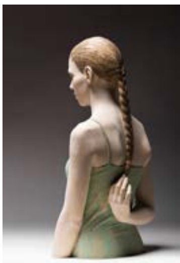
Bruno Walpoth, „Sara mit Zopf“, 2016, Holz