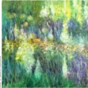
Beatrix Kutschera, „Platz an der Sonne“, 2015, Acryl auf Leinwand

Laufende Ausstellung bis 26. Februar im LANGENZERSDORF MUSEUM Obere Kirchengasse 23