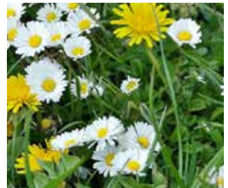
In Langenzersdorfer Grünanlagen entstehen Blumenwiesen.

Blumenreiche Wiesen zählen zu den schönsten Bestandteilen unserer Kulturlandschaft. Was wir im Urlaub bewundern und lieben, schätzen wir kaum im eigenen Garten. Jedes Gänseblümchen, jeder Löwenzahn, jedes „Unkraut“ wird erbarmungslos verfolgt und mit