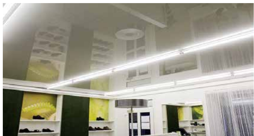
Boutique mit einer Spanndecke

Neue Deckengestaltung mit Spanndecken Nie mehr streichen - keine Risse - kein Schimmel - kein Schmutz. Ab sofort wird das Renovieren oder Verändern von Wänden oder Zimmerdecken jeder Größe zur leichten Aufgabe. Wir entwerfen Ihre Spanndecke exakt nach Ihren Wünschen - jede Größe, jedes Design, Bilder auch hinterleuchtet möglich.