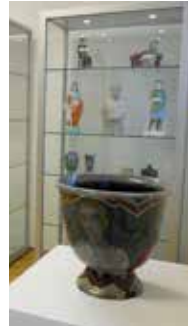
Raumansicht Eduard Klablana

Führungsbeitrag: € 2,- zzgl. Museums- eintritt/NÖ-CARD