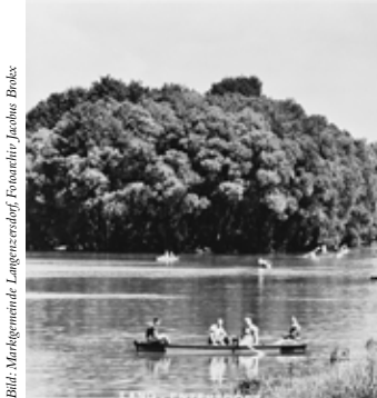
Bootsverleih und Donau-Überföhr Vockenhuber, um 1930

LANGENZERSDORF MUSEUM, Obere Kirchengasse 23