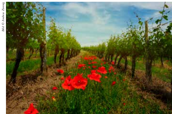
Mohnblüte am Jungenberg