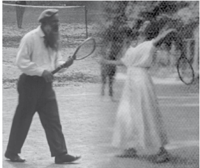
Tennisspieler um 1900

Von Anfang an frönten in Langenzersdorf sowohl Damen als auch Herren dem „weißen“ Sport. Denn die Sportbe-