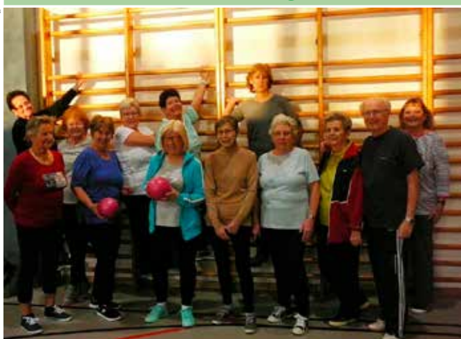
Gymnastikstunde der PensionistInnen

Die wöchentliche, sehr beliebte Gymnastikstunde wird gerne von vielen junggebliebenen Langenzersdorfer- Innen besucht. Dehnen, Strecken, Kräftigen – Gymnastik für Senioren ist genau das Richtige, um sich schonend in Form zu halten.