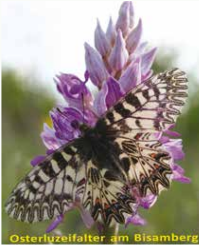
Osterluzeifalter am Bisamberg

In diesem Frühjahr startet das Projekt BLÜHLINGE (Blühende Landschaften für Schmetterlinge in der Slowakei und Österreich) in Langenzersdorf. Weil Schmetterlinge stark gefährdet sind werden im grenzüberschreitenden Projektgebiet von Langenzersdorf über Wien, Marchegg, Bratislava bis nach Zahorie Blühflächen angelegt auf denen die Bestäuber landen, Nektar finden und sich verbreiten können.