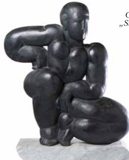
Giovanni Rindler, „Sitzender“, 1995, Bronze mit Marmorsockel

Die Ausstellung „FIGUR!“ im LANGENZERSDORF MUSEUM gibt einen umfassenden Überblick über das Werk des in Südtirol geborenen und in Wien lebenden Bildhauers Giovanni Rindler (geb. 1958). Im Zentrum von Rindlers Schaffen steht die menschliche Figur: Auf den ersten Blick naturalistisch anmutend, offenbart sich bei genauerer Betrachtung das perfekte Zusammenspiel von geometrischen Formen, die die Dargestellten, trotz ihres Volumens, leichtfüßig und schwebend erscheinen lassen.