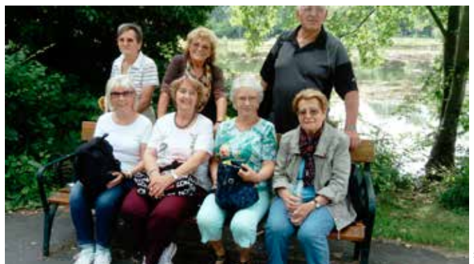
Wanderung im Wasserpark

Aktuelle Informationen finden Sie in den Schaukästen!