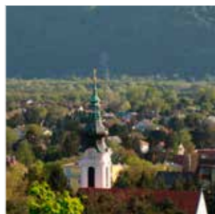
Ausblick vom Venusgarten