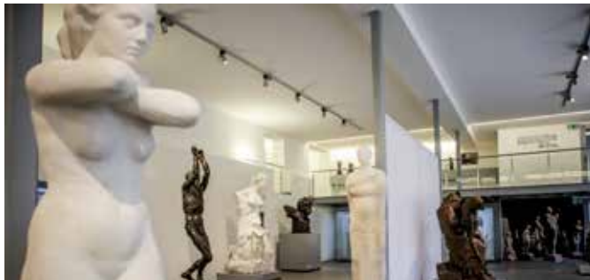
Raumansicht Anton Hanak