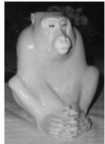
E. Klablerna: Pavian um 1911

ebenfalls im Hause Berggasse 11 wohnenden, etwa 7 Jahre alten Knaben Otto Berger zweimal modelliert, auf dem Fußboden sitzend, einmal bekleidet und 14 cm hoch (siehe die Abbildung) und einmal als Aktfigur, 17 cm hoch und auf der Fläche der Fußsohlen signiert mit dem eingedrückten dreizehnligen Stempel Interessant ist ferner eine 38 cm hohe Figur einer „Mode-Dame“, stehend, das bodenlange Kleid an der linken Brust ausgespart, signiert mit dem vorhin erwähnten Pressstempel. Das Muster des Kleides mit langen Reihen konzentrischer Kreise (siehe Abbildung) erinnert an den um 1905-09 von Gustav Klimt geschaffenen Mosaikfries für das Palais Stoclet in Brüssel. Schließlich ist noch die Darstellung eines sitzenden Pavians zu nennen (18 cm hoch, siehe die Abbildung), der durch die Marke EK auf der Unterseite der Fußplatte (siehe die Detailabbildung), eine Änderung in der bisherigen Signier-Praxis Klablernas ankündigt.