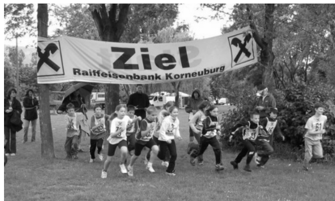
Kinder-Leichtathletik-Dreikampf der Sportunion Langenzersdorf in der Seeschlacht