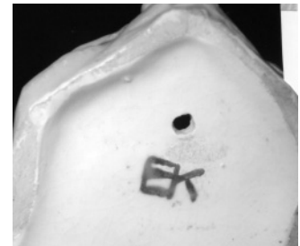
Detail zum Pavian: Signatur auf der Fußplatte