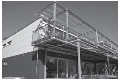
links: Kindergarten I und III