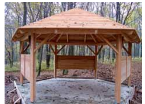
Text & Layout: mediadesign