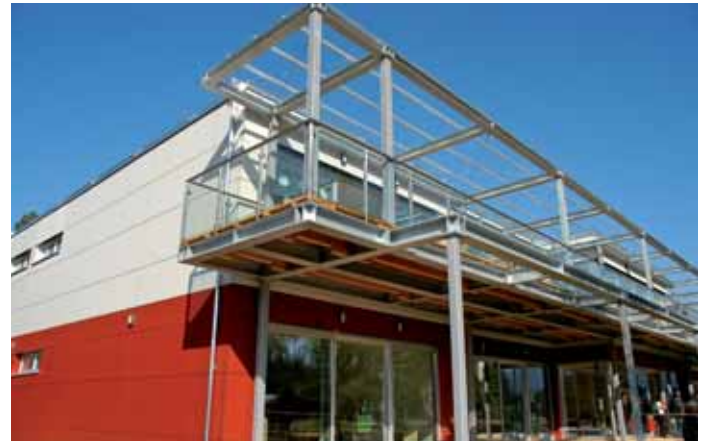
Nicht nur von außen ist das neue Kindergartengebäude etwas Besonderes.