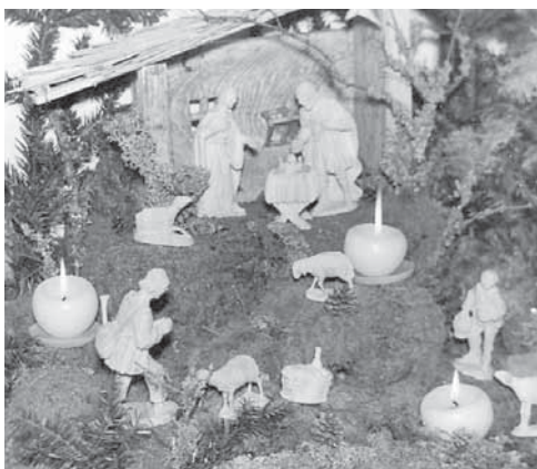
Die erste Krippe, mit der die Sammlung OSR F.K. Schwarzmann begründet wurde.

Die Bedeutung des Christfestes wird durch die Vorbereitungszeit des Advents unterstrichen. Mit der Geburt Jesu ist im christlichen Verständnis Gott Mensch geworden. Damit ist das wahre Licht der Erleuchtung unter den Menschen erschienen. Das soll auch in den Kerzen am Adventkranz und am Christbaum zum Ausdruck kommen. Von der inneren Erleuchtung ist jedenfalls die äußere Beleuchtung geblieben. In die dunkle Zeit des Jahres wird schon im Advent mit viel Licht, Girlanden und gleißenden Auslagen ein Contrast gesetzt. Auch unser Ort präsentiert sich seit dem Rückbau der Ortsdurchfahrt erstmals seit 1989 im geschmackvollen vorweihnachtlichen Lichterglanz.