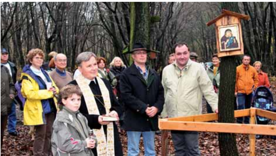
Im Jubiläumsjahr 2008 wurde durch den Tourismusverein Langenzersdorf eine neue Bildereiche samt Unterstandshütte errichtet, um die Tradition der Waldandachten für die Bevölkerung zu bewahren. Die Segnung fand am 8. November durch unseren Herrn Pfarrer statt.