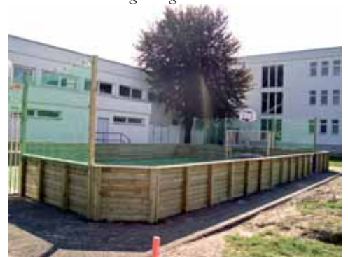
Die Langenzersdorfer Volksschulkinder freuen sich über den von der Gemeinde errichteten Funccourt.