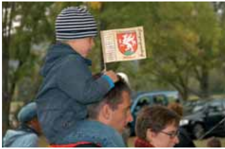
Die Festtage vom 19. bis 21. September 2008 boten anlässlich des 900-Jahr-Jubiläums viel Buntes, Historisches und Einmaliges.