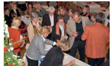
Der Büchertisch war bis zum Schluss mit dem Verkauf des neuen Buches ausgelastet.