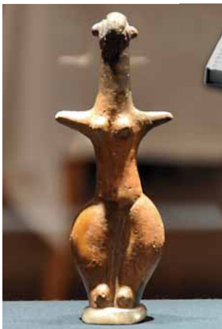
Erstmals konnte die Original-Venus von Langenzersdorf öffentlich bewundert werden.