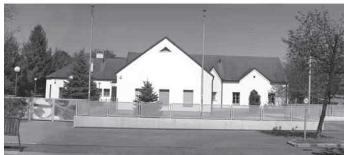
unten: Kindergarten II