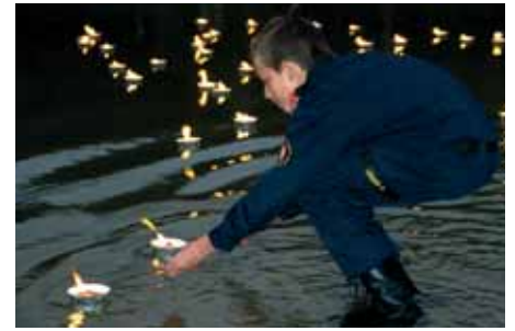
In der Dämmerung setzte die Feuerwehrjugend gemeinsam mit den euLEn 900 brennende Lichtkerzen in den See.