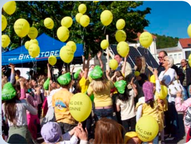
Bilder (3) z. Vg.

Der Tag der Sonne stand am 6. Mai in Langenzersdorf ganz im Zeichen der Erneuerbaren Energie, allen voran, der Solarenergie.