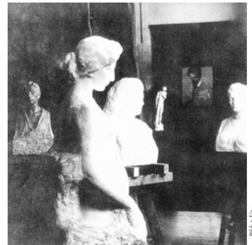
Teilansicht des ersten Ateliers von A. Hanak, 1905

Fortsetzung folgt. (Copyright und alle Rechte beim Verfasser)