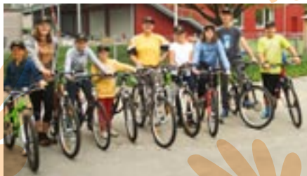
Bei sommerlicher Temperatur freuten sich die Kinder auf einen Radausflug.