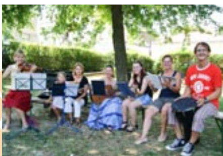
Die Musikschule veranstaltete gemeinsam mit der Musikkapelle einen rhythmischen Nachmittag mit viel Spaß.