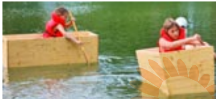
Trotz des anfangs kalten Wetters ließen sich die Kinder den Spaß nicht nehmen, im Sautrog um die Wette zu paddeln.