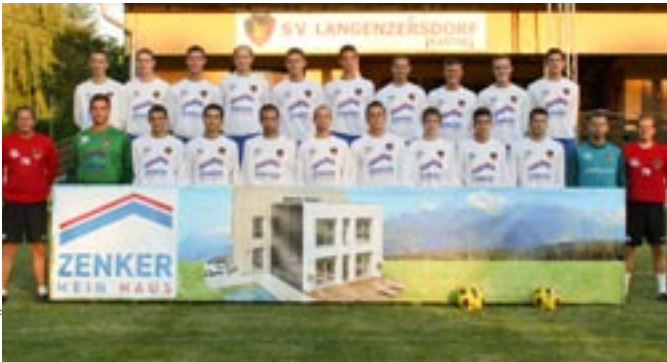
Die Spieler des Sportverein Langenzersdorf präsentieren ihre neuen Dressen.