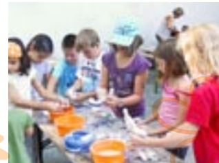
Der Kreativität der kleinen Künstler waren keine Grenzen gesetzt.