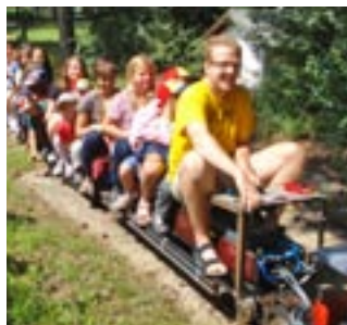
Die Fahrt mit der kleinen Lok war das Highlight beim Besuch des „Eisenbahnmuseums Heizhaus Strasshof“.