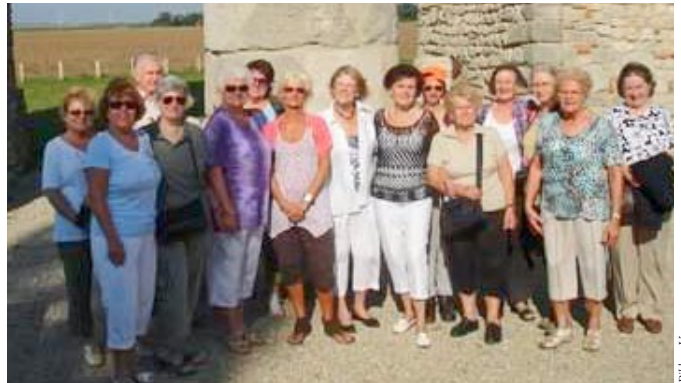
Langenzersdorfer PensionistInnen bei der NÖ Landesausstellung

Donnerstag, 6. und 20. Oktober: Klubnachmittag am Alten Bahnhof von 14:00 bis 18:00 Uhr