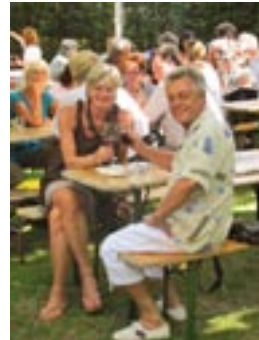
Ein Prost auf die gute Stimmung bei unserem Sommertreffen im Garten unseres Siedlerheims

Samstag, 1. Oktober , ab 15:00 Uhr Monatstreffen mit Kaffeegäule in gemütlicher Runde.