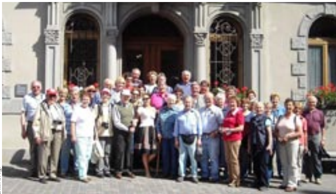
Vor dem Rathaus Stein am Rhein (Schweiz)

Dienstagtreff, 4. Oktober, 15:00 Uhr im Pfarrzentrum Dirnelwiese