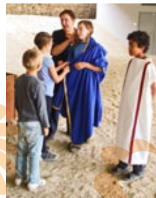
Auch die NÖ Landesausstellung in Carnuntum war einen Besuch wert.