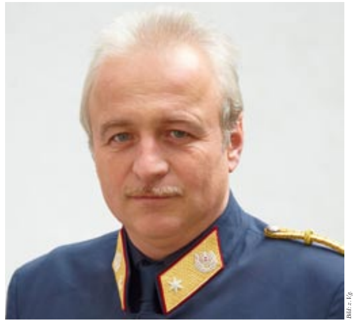
Brigadier Martin Germ, Leiter des Verkehrsreferates im BM für Inneres

Erfreulich ist, dass die seit 1961 geführte Verkehrsunfallstatistik trotz Zunahme der Motorisierung einen deutlichen Rückgang der schweren Verkehrsunfälle zeigt. Wurden 1972 noch fast 3000 Menschen im Straßenverkehr getötet, so hat sich die Zahl solcher Unfälle auf derzeit etwa 550 verringert. Dafür waren gesetzliche Vorgaben wie die Gurtenpflicht und die Alko-Grenze, aber auch die Kontrolldichte (Radarboxen) wesentlich. Im Bundesländervergleich der „Todesstatistik“ nach absoluten Zahlen nimmt NÖ den ersten Platz ein. Die wenigsten solcher schweren Unfälle ereig-