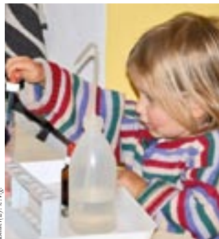
Bilder 2) z. l. g.