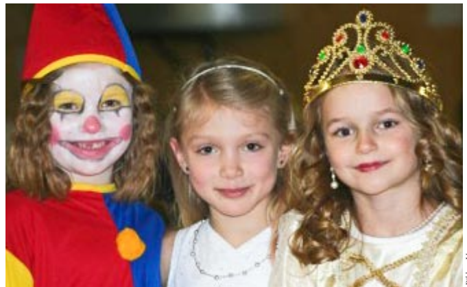
Bilder z. l. g.