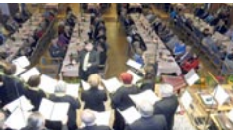
Weihnachtsfeier mit der Chor- vereinigung der Finanz Wien

Mittwoch, 1. Februar: 15:00 Uhr, Treff in der Vereinshalle Donnerstag, 2. Februar: Halbtagesfahrt in eine Winterlandschaft mit anschl. Kabarett Dienstag, 7. Februar: 15:00 Uhr, Treff im Pfarrzentrum Dirnelwiese Vorschau: 11. bis 18. März: Gesundheitswoche in Bad Vöslau 13. bis 19. April: Fahrt zum Lago Maggiore 14. bis 19. August: Flussschiffahrt, Rhein – Mosel – Saar Weitere Informationen entnehmen Sie bitte unserem Schaukasten beim Gemeindeamt.