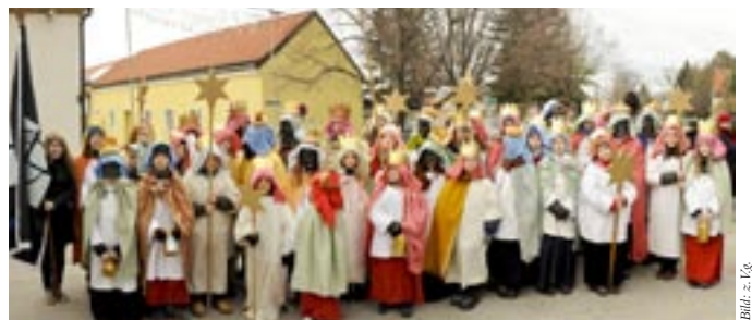
Die Sternsinger der Pfarre St. Katharina

Vom 6. bis 8. Jänner waren die Sternsinger der Pfarre St. Katharina im Rahmen der Dreikönigsaktion der katholischen Jungschar unterwegs. Mit ihrem Singen und ihren Wünschen haben sie viele Türen und Herzen geöffnet. Für soziale Projekte haben 12 Sternsingergruppen € 10.250,- gesammelt, welche heuer Fischerfamilien auf den Philippinen zu Gute kommen. Ein großes Dankeschön an alle Spender!