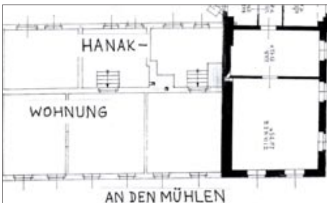
Grundriss des Straßentraktes

Die Begründung dafür liefert ein Blick auf den Gebäudegrundriss (siehe die Abbildung): die straßenseitig gelegenen Zimmer liegen höher als die hofseitigen Räume (Küche usw.) und werden über vier Stufen, die im Gebäudeinneren angeordnet sind, erreicht. Dies entspricht einer bewährten Bauweise bei den alten Müllerhäusern am Ufer der Donau, da bei Hochwasser die höher an-