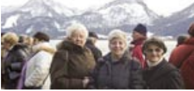
Langenzersdorfer PensionistInnen am Wolfgangsee

Dienstag, 7. Februar: Turnen im HS-Turnsaal 16:00 Uhr Donnerstag, 9. und 23. Februar: Klubnachmittag im Alten Bahnhof von 14:00 bis 18:00 Uhr Donnerstag, 16. Februar: „Das Land des Lächelns“, Volksoper, Beginn 19:00 Uhr Dienstag, 21. Februar: Faschingsrummel bei Heurigen Ernst Trimmel, Beginn 15:00 Uhr Bitte beachten Sie die Informationen in unseren Schaukästen!