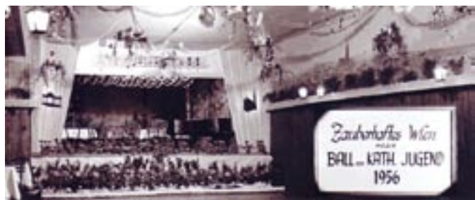
KJ-Ball 1956, zauberhafte Dekorationen für „Zauberhaftes Wien“