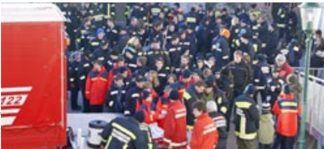
Bilder (3): z. Vg.