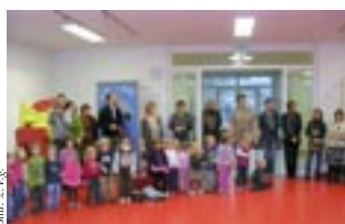
Gäste der Partnerkindergärten mit Kindern und dem Team des KIGA III

Englisch ist integrativer Bestandteil in den Landeskinder- gärten Niederösterreichs.