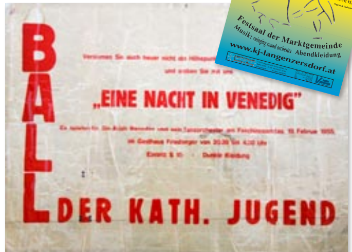
KJ-Ball Plakat von einst (1955) und heute (2012)

Die Kleider der Debütantinnen waren damals aus Papier, so wie auch die meist prächtigen Dekorationen im Friedberger- Saal (heute: Billa)