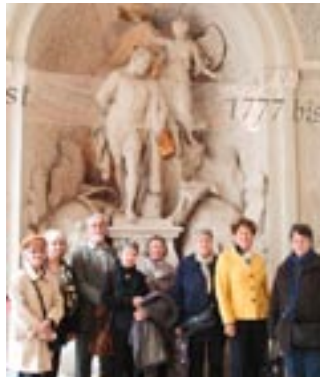
Besuch des Theatermuseums im Palais Lobkowitz.

Donnerstag, 10. Mai: Muttertagsfahrt nach Illmitz, Abfahrt 8:30 Uhr, Enzo-Platz