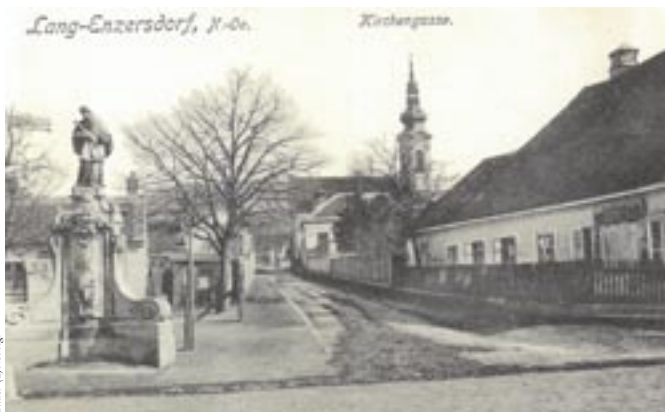
Die Ansichtskarte aus 1917 zeigt das Johannes Nepomuk-Denkmal, die Obere Kirchengasse und das Guggenberger Haus, das 1969 dem Ausbau der Ortsdurchfahrt weichen musste.

angerufen worden ist. Unlängst wurde dort ein an der Ecke zur Kirchengasse stehender Laubbaum, der die unpassende Steineinfassung gesprengt hatte, gefällt. Manchen gefiel das nicht, war aber notwendig.