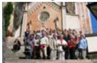
Gruppe Senioren in Trentino, Kirche Madonna de Corona am Monte Baldo.

14. bis 19. August: Flussschiffahrt, Rhein – Mosel – Saar