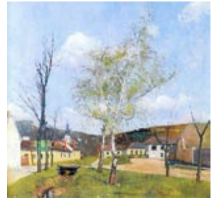
Platz vor dem Jägerhaus von Langenzersdorf (um 1925)

Fortsetzung folgt. (Copyright und alle Rechte beim Verfasser)