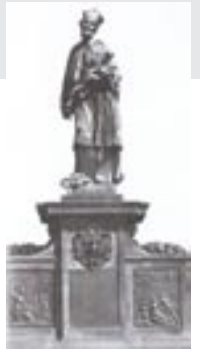
Die Statue des Heiligen auf der Karlsbrücke in Prag