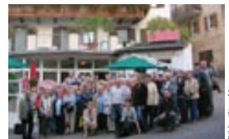
Gruppe des Seniorenbundes in Südtirol/Truden.