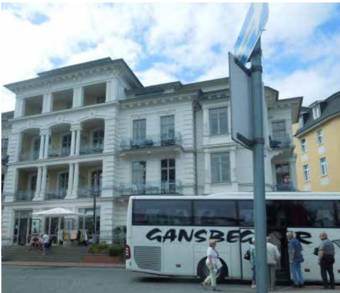
Kurhaus im Ostseebad

auf der Insel Rügen. Organisatorin Gertrude Heinisch lud zur nächsten Tagesfahrt ein.