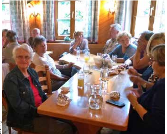
Grillhendlessen vor der Sommerpause

Geselliges Zusammentreffen bei Kaffee und Jause, Gäste sind wie immer herzlich willkommen!