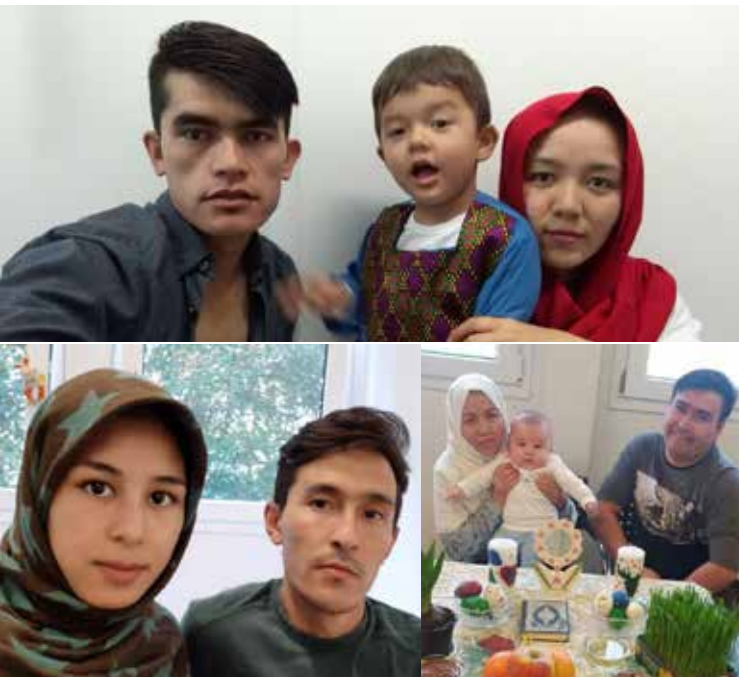
Auf Herbergssuche ...

Wir beraten Sie gerne über mögliche Varianten und spezielle Erfordernisse. Selbstverständlich werden wir diese Flüchtlinge auch weiterhin in den privaten Quartieren betreuen.