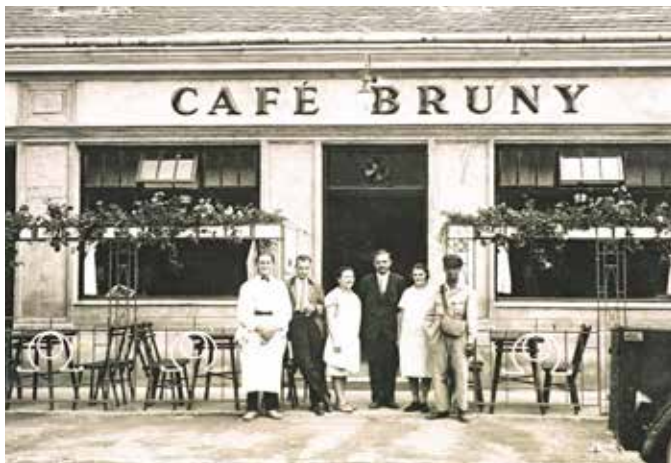
Café Bruny (Korneuburger Straße 17), um 1930