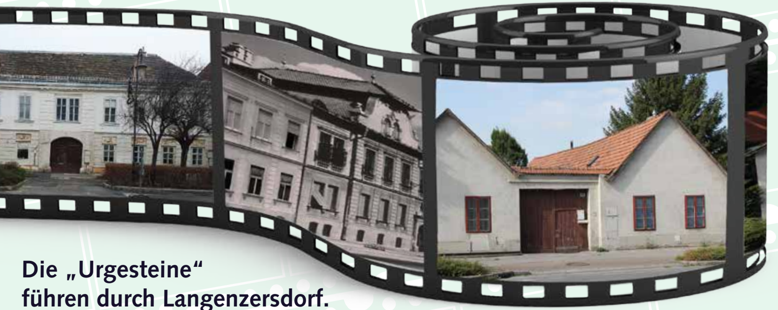
Die „Urgesteine“ führen durch Langenzersdorf.

Festsaal Langenzersdorf, Hauptplatz 9 Eintritt frei, Jausenbuffet!