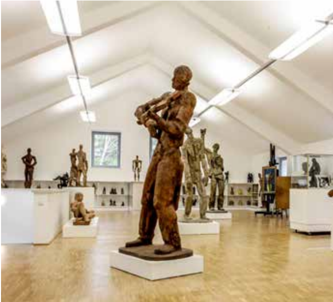
Raumansicht Siegfried Charoux