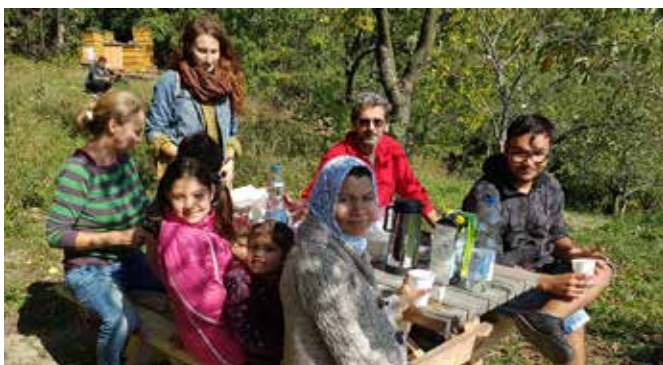
... mit anschließendem Arbeitspicknik

ges ermöglichten eine sehr karge und handarbeitsintensive Waldbrandwirtschaft. Und genau hier, unweit des heutigen Venusgartens, begann die Entwicklung der Kulturlandschaft am Bisamberg zum Hotspot einer vielfältigen Flora und Fauna.