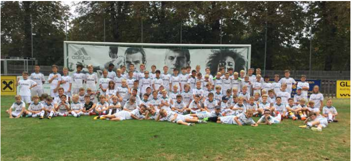
100 Kinder nahmen am SVLE-Fußballcamp mit Real Madrid Fundacion-Betreuern teil.