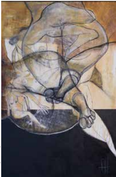
Angelika Hofmeister, „Reigen“, Tische und Mischtechnik auf Leinwand, 2018

Ausstellung der Berufsvereinigung der bildenden Künstler für Wien, Niederösterreich und Burgenland LANGENZERSDORF MUSEUM, Obere Kirchengasse 23