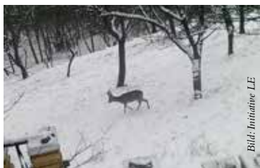
Tierische Gäste im Venusgarten

kleinräumigen Auswirkungen Bescheid wissen. Wir brauchen Gefühl für Farben und Formen und die Wirkung des Raumes. Wir müssen Verordnungen beachten und oft genug Gespräche mit Nachbarn suchen.“