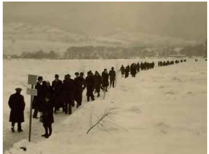
Eisstoß 1929, Fußgänger auf der zugefrorenen Donau bei Langenzersdorf

Anhand von zum Teil noch nie öffentlich gezeigten Aufnahmen, ergänzt durch Gemälde und Dokumente, wird das Ortsbild und (Alltags-)Leben in Langenzersdorf im ersten Drittel des 20. Jahrhunderts nachgezeichnet.