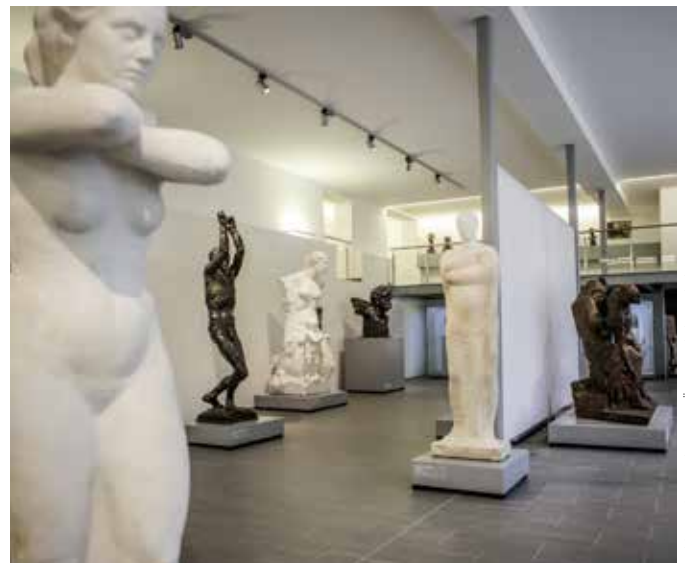
Raumansicht Anton Hanak

Bei Interesse ersuchen wir um Kontaktaufnahme unter 02244 3718 bzw. office@lemu.at , www.lemu.at .