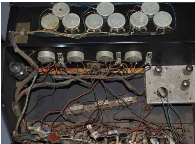
Der optische Synthesizer von Max Brand