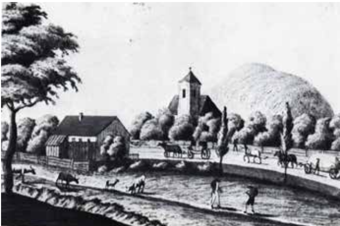
Kirche von Langenzersdorf um 1709

vorhanden – Anm: im rechten Seitenschiff, jetzt verdeckt von einem Bild des Hl. Josef). Dadurch wurden der neue Hochaltar zerstört und die Gräber des um die Kirche gelegenen Friedhofs derart ausgewaschen, dass die Gebeine der Verstorbenen unbedeckt herumlagen. Deshalb wurde der Gottesacker 1738 durch eine hohe und feste Mauer geschützt. In weiterer Folge wurde der Kirchenbach, der ursprünglich an der Westseite der Kirche (Anm.: in der Oberen Kirchengasse) vorbei floss, am Beginn der Kellergasse derart abgelenkt, dass er nunmehr östlich der Pfarrkirche ein neues Bett mit seitlichen Dämmen bekam.“