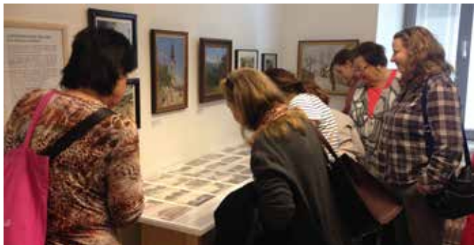
Besucher der Ausstellung „Langenzersdorf 1900-1930. Eine Zeitreise in Bildern“

Samstag, 5. Oktober, 14:00-21:00 Uhr LANGENZERSDORF MUSEUM, Obere Kirchengasse 23