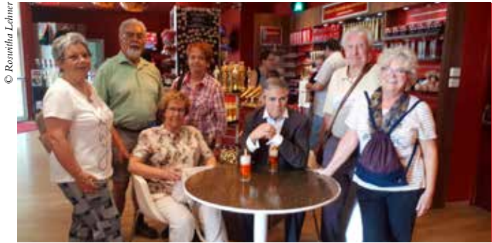
Besuch Madame Tussauds

Donnerstag, 17. Oktober: Gratis-Busfahrt Stift Klosterneuburg und Nationalbibliothek, Eintritte: Stift € 10,- und Nationalbibliothek € 6,-. Treffpunkt: 12:30 Uhr Enzo-Platz Nähere Informationen bzw. Änderungen zu den Veranstaltungen finden Sie in den Schaukästen.