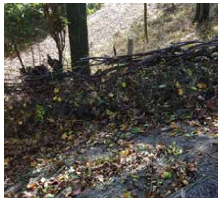
Naturdeponie und Winterquartier im Venusgarten

Die Grünabfälle im Venusgarten sind eine Herausforderung. Wohin mit dem vielen Mäh- und Schnittgut? Händisch hinuntertragen und abtransportieren wäre höchst aufwändig.