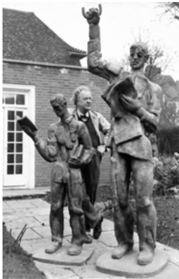
Siegfried Charoux im Garten seines Wohnhauses und Ateliers in Temple Fortune Hill, London, um 1960

Der Bildhauer und Maler Siegfried Charoux (1896–1967), dessen Nachlass als Schenkung seiner Witwe Margarethe im LANGENZERSDORF MUSEUM beheimatet und permanent ausgestellt ist, erfreut sich auch in diesem Jahr in Großbritannien – Charoux' Wahlheimat nach seiner Emigration aus Österreich – einer größeren Aufmerksamkeit: Im Rahmen des „ Insiders/Outsiders “-Festival ist Charoux in der Ausstellung „Refuge and Renewal: Migration and