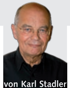
von Karl Stadler