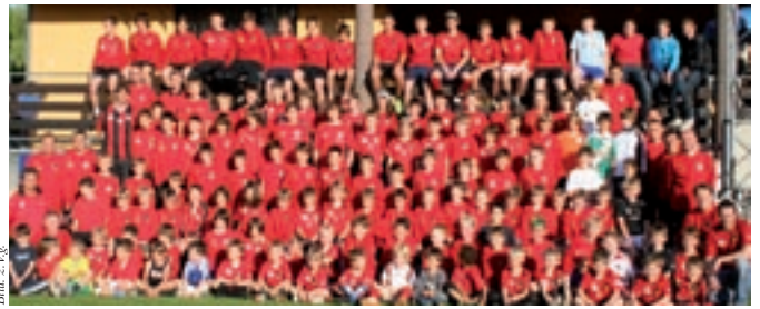
172 Mädchen und Buben sind begeisterte Fußballer des SV LE.

In der Kampfmannschaft und Reserve des SV Langenzersdorf kämpfen jede Woche viele junge Spieler aus Langenzersdorf und Umgebung in der Meisterschaft. Mittlerweile spielen 172 Mädchen und Buben der Jahrgänge 1994 bis 2005 Fußball beim Sportverein. 18 ausgebildete Trainer kümmern sich um kindgerechtes Training und Spiel. Ziel im Kinderfußball ist Spaß am Spiel und an der Bewegung zu vermitteln, keinesfalls knochenhartes Konditionstraining. Es gilt die Persönlichkeitsentwicklung und soziale Kompetenz der Kinder zu fördern und zu einem gesunden Körperbewusstsein und einer sportlichen Lebenseinstellung beizutragen. Ein wertvoller Teil der Nachwuchsmannschaften sind Mädchen, die bis zum 15. Lebensjahr gemeinsam mit den Buben an der Meisterschaft teilnehmen dürfen. Seit 2007 nimmt eine Frauenmannschaft am Meisterschaftsbetrieb teil. Der SVLE sucht auch weiterhin Nachwuchsspieler und Trainer. Sportbegeisterte Mädchen und Buben sowie Erwachsene, die an der Arbeit mit Kindern interessiert sind, können sich bei Jugendleiter Christian Trauner (0664 3025197) melden. Der Vorstand des SV Langenzersdorf bedankt sich stellvertretend für elf Nachwuchsmannschaften, Kampf-, Reserve-, Frauen- und Seniorenmannschaft für die Unterstützung der Fans und Sponsoren und wünscht diesen und allen GemeindegängerInnen ein frohes Weihnachtsfest und einen guten Rutsch in ein erfolgreiches Jahr 2010.