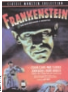
Der furchterregende „Frankenstein“