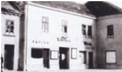
Unser Kino in den 50er Jahren

Die nächste eher kleine Baumaßnahme im Kino, jetzt wieder Hauptplatz 3, erfolgte 1952 durch Baumeister Ing. Franz Grassl, der auch den Um- bzw. Zubau des Warteraumes, der Vorführkabine und der Heizanlage im Jahr 1957 durchführte.