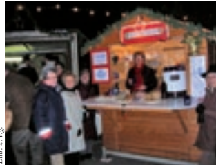
Das Team freut sich auf Ihren Besuch.

Di, 1.12., 15:00 Uhr, Treff im Pfarrheim Dirnelwiese