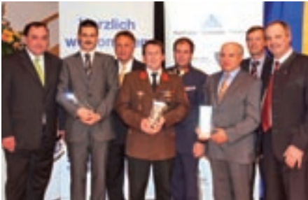
Die Police-Safety-Award Verleihung

Am 10.11.2009 fand erstmals im Bezirk Korneuburg die Police-Safety-Award Verleihung statt. Im Rahmen einer Feierstunde im Festsaal der Marktgemeinde Langenzersdorf wurden in den Kategorien „Blaulicht“, und „Zivilcourage“ Mitglieder der Feuerwehr, Rettung, Justiz, Polizei und des Bundesheeres als auch Personen, die eine besondere Leistung wie z. B. Lebensrettung oder Mithilfe bei der Verbrechensbekämpfung erbracht haben, ausgezeichnet. Darüber hinaus wurden Personen aus dem öffentlichen Leben, die sich besonders für die Sicherheit im Bezirk Korneuburg eingesetzt haben, geehrt.