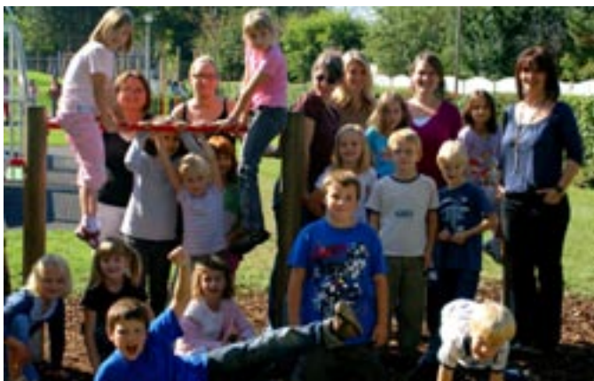
Mit viel Engagement ging das Lehrerteam der VS Langenzersdorf in das neue Schuljahr!

Heuer startete die Volksschule Langenzersdorf mit einer Integrationsklasse. Neben der Klassenlehrerin unterrichtet zusätzlich eine Sonderschullehrerin und auch eine Pflegerin unterstützt hilfreich. Durch dieses Modell werden die sozialen Kompetenzen aller Kinder im Umgang miteinander auf natürliche Weise gefordert und gefördert.