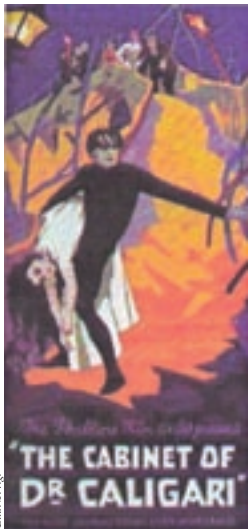
Ein Kinoplatz für den Stummfilmklassiker „Das Cabinet des Dr. Caligari“

Bereits in der Stummfilmzeit kündigte sich eine Art Kulturkampf zwischen Hollywood (US- Amerika) und den europäischen Filmproduzenten an. Der Starkult kam aus Übersee und wurde bei uns begeistert übernommen. Waren es bei den Frauen Asta Nielsen, Henny Porten oder Pola Negri so war bei den Männern zweifellos Rudolfo Valentino die Nummer 1. Es gab aber auch den Film als Kunstwerk wie etwa den expressionistischen deutschen