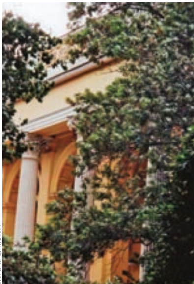
Eingangsbereich des südlichen Amateurpavillons (erbaut 1872/73) im Wiener Prater.

und ab 1932 als Akademieprofessor – getreu dem Vorbild seines Lehrers Hellmer – fallweise auch seine Schüler. Nach seinem plötzlichen Tod am 7. Jänner 1934 fasste das Kollegium der Akademie der bildenden Künste den Beschluss, diese Arbeitsräume im Prateratelier zum Gedenken an den großen Bildhauer und Lehrer als Hanak-Museum einzurichten.