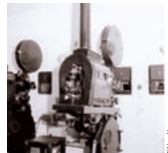
Gustav Czastka im Vorführraum und der Vorführapparat

Im Gegensatz zum Bisamberger Kino hatten wir in LE damals bereits zwei Vorführapparate, sodass es keine lästigen Pausen während des Films gab. Die Filmrollen wurden damals persönlich aus dem 7. Bezirk in Wien geholt und noch am Abend nach der Vorstellung mit der Bahnpost zurückgesendet. Zeitweise waren auch Motorradfahrer für den Weiter- bzw. Rücktransport der kostbaren Filmrollen eingesetzt.