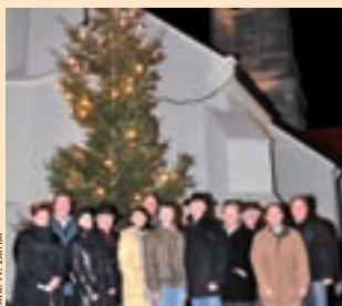
Das Team des Tourismusvereins

Der Tourismusverein veranstaltet den zur Tradition gewordenen Adventmarkt auch heuer wieder von Freitag, 27. November, bis Sonntag, 29. November, vor der Pfarrkirche St. Katharina. Genießen Sie dieses stimmungsvolle Ambiente und das umfangreiche Rahmenprogramm. In gewohnter Weise findet auch der Adventkunstmarkt am Samstag, dem 28. November, und Sonntag, 29. November, im Festsaal statt. Der Elternverein Langenzersdorf richtet für unsere Kinder im Alter von 3 bis 10 Jahren eine Adventbastelstube am Samstag, 28. November, von 10:00 bis 17:00 Uhr im Festsaal ein. Nützen Sie das angebotene Programm (im Detail auf Seite 7), um sich auf die Adventtage einzustimmen. Die Veranstalter freuen sich auf Ihren zahlreichen Besuch!