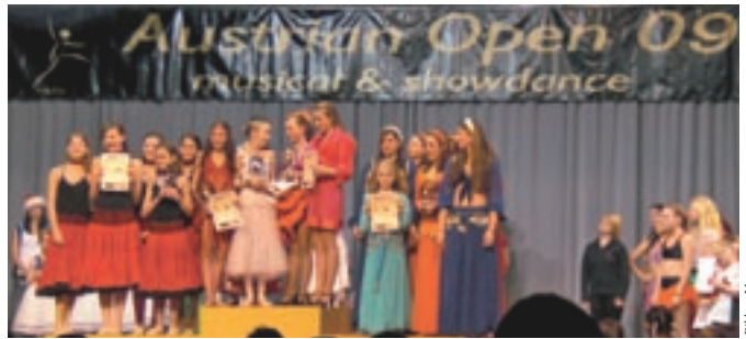
Mit tollen Platzierungen schafften die Teilnehmer des Tanzstudio Elizabeth Mills die Qualifikation für die European Open.

Der Verein „Tanzstudio Elizabeth Mills“ (Verein zur Förderung junger Tanztalente) konnte bei den „Austrian Open 2009 in Musical- und Showdance“ vom 27. – 29. März in Matri/Osttirol mit mehreren Beiträgen in verschiedenen Tanzkategorien folgende herausragende Platzierungen erreichen: