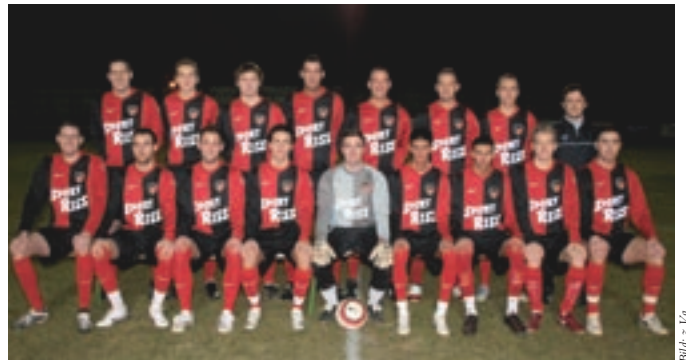
Die Mannschaft des SVLE

Erstmals nach dem Wiederaufstieg steigt am 1. Mai 2009 ab 19:30 Uhr am Sportplatz Langenzersdorf das Derby gegen Korneuburg. Das Match erhält noch zusätzliche Brisanz, da sowohl Korneuburg als auch der SVLE die Punkte dringend brauchen, um nicht Gefahr zu laufen, aus der Gebietsliga abzustiegen. Schon um 17:30 Uhr stehen sich die Reserve-Mannschaften gegenüber. Dabei sind die jungen Langenzersdorfer (Altersschnitt 19,6 Jahre) als Tabellenführer klarer Favorit. Im Monat Mai gibt es noch zwei weitere Heimspiele – am 15. Mai gegen Leitersdorf und am 29. Mai gegen Meyersdorf.