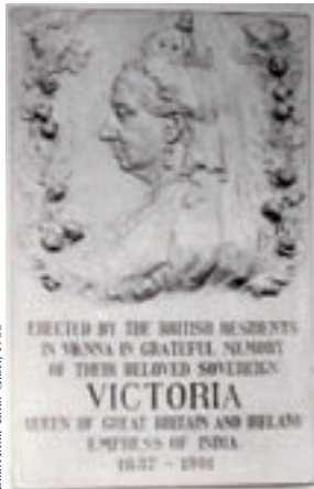
Gedenktafel für die brit. Königin Victoria, von Anton Hanak, 1901

Einen kleinen Auftrag habe ich bekommen, den ersten. Eine Gedenktafel für die verstorbene Königin Victoria in