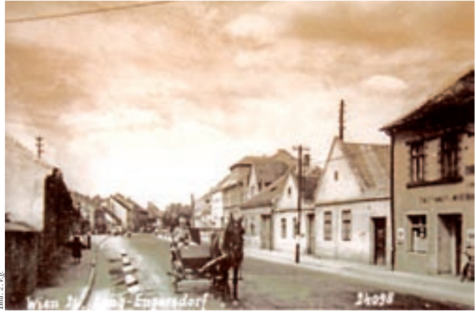
Die alte Hauptstraße beim Hirschenhof, Richtung Hauptplatz mit Pferdefuhrwerk

Für die Wasserversorgung hatte fast jedes Haus einen gegrabenen oder geschlagenen Brunnen. Das Wasser musste meist händisch heraufgepumpt werden. Das damit durchaus kostbare Nass wurde dann mit Kübeln zum Ort der Verwendung (Küche, Waschen, Garten etc) gebracht. Einige Häuser hatten bereits elektrische Pumpen, die aber wegen der häufigen Stromausfälle nur beschränkt zur