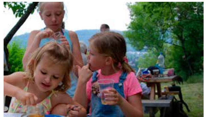
Für die jungen Gäste gibt es eine lustige Bienen-Bastelstation. Schmackhaft wird es bei den Honigkostproben.

Königin, Drohne oder Arbeiterin – wer hat welche Aufgabe im Bienenstock? Was ist denn der „Hochzeitsflug“ und wie organisiert sich ein Bienenvolk? Neugierig geworden? Na dann, rauf in den Venusgarten!