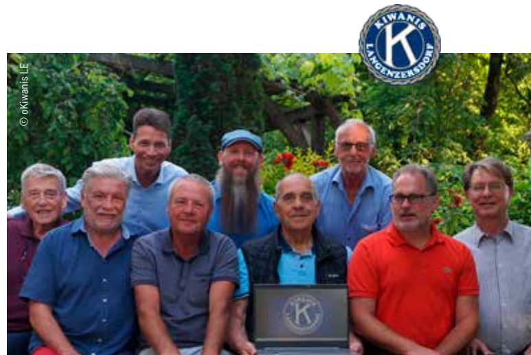
Kiwanis Freunde bei der Vorbereitung für die Kinder-Unterstützung

Da sich die Unterrichtsmethoden jedoch vermehrt von der analogen Vergangenheit in Richtung der Erfordernisse unserer digitalen Welt weiterentwickeln, ist nun erstmals das Thema „Laptop bzw. Notebook“ auf die Unterstützungsliste gekommen.