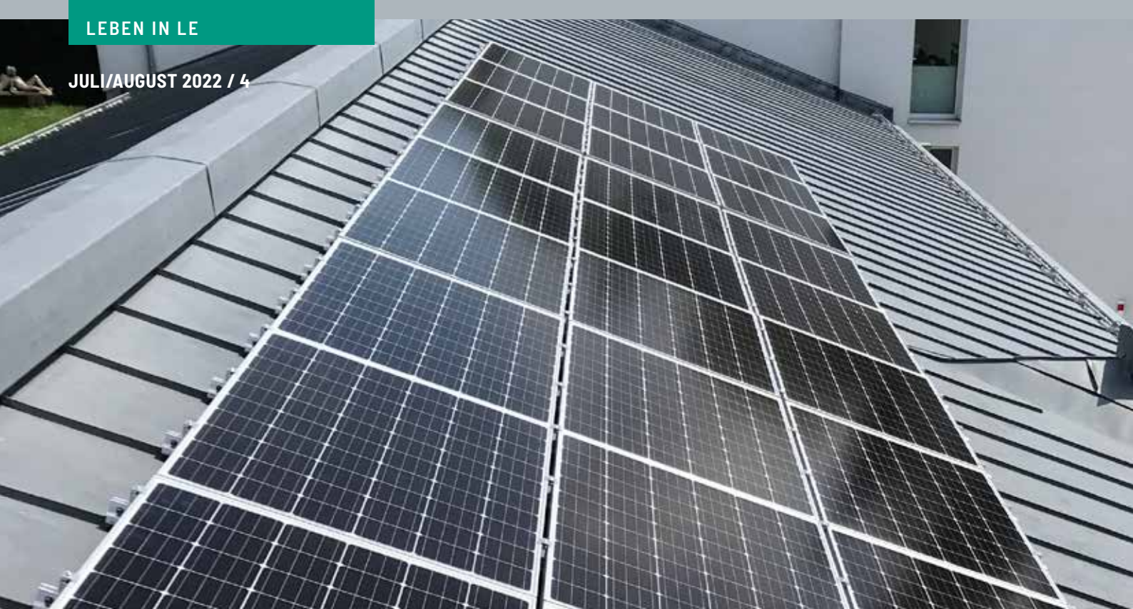
Photovoltaik-Anlagen auf dem LANGENZERSDORF MUSEUM