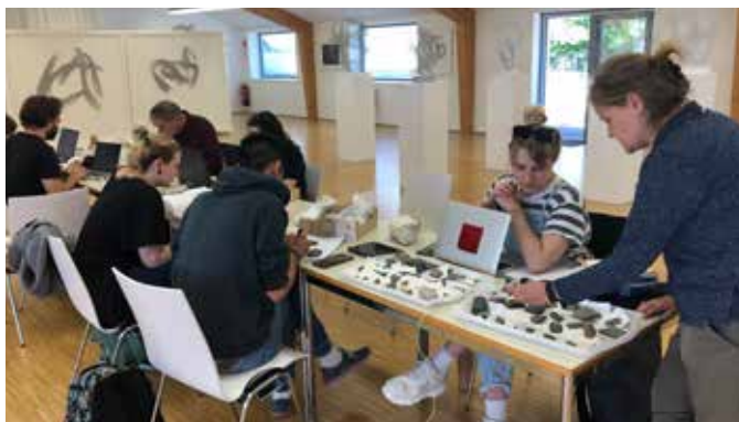
Aufarbeitung und Befundung einer Skulptur von Alois Heidel des Urgeschichtsdepots

Infos und Anmeldung für Führungen unter office@lemu.at, Tel. 02244 3718