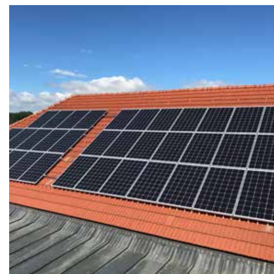
... auf dem Dach des Gemeindeamts.