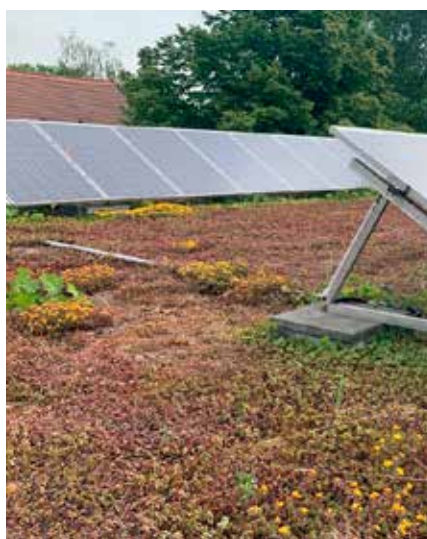
... auf dem Haus des Kindergartens II.