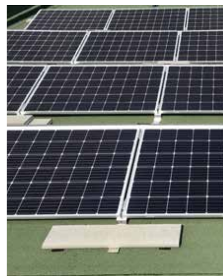
... auf dem Gebäude der Volksschule.

wird der CO 2 -Ausstoß maßgeblich reduziert.