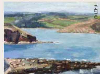
„Cornwall“ von Siegfried Charoux, um 1950, Öl auf Sperrholz

Ich hoffe, du bist mit diesem Bild in Urlaubsstimmung gekommen! Du kannst das Gemälde und noch viele andere Werke von Siegfried Charoux im LEMU – LANGENZERSDORF MUSEUM jeweils Samstag, Sonntag und Feiertag von 14:00 bis 18:00 Uhr (Kassaschluss 17:30 Uhr) besichtigen. Alle Infos findest du unter www.lemu.at sowie www.facebook.com/LangenzersdorfMuseum .