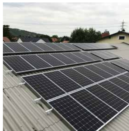
... auf dem Gebäude des Bauhofes.

Die sauberste Energie ist die, die nicht verbraucht wird. Energieeffizienz ist daher von entscheidender Bedeutung, um