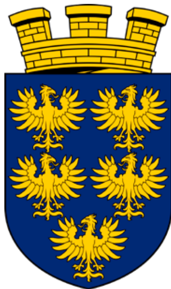
Das aktuelle Wappen von Niederösterreich (oben) und das alte Wappen beim Schweizerter in der Hofburg (unten)

1994 brachte die Volksabstimmung über den Beitritt Österreichs zur Europäischen Union (damals zwölf Mitglieder) eine mehr als 70-prozentige Zustimmung. Die nächsten Jahrzehnte bis zum 24. Februar 2022 waren politisch im Großen und Ganzen eine friedliche Zeit.