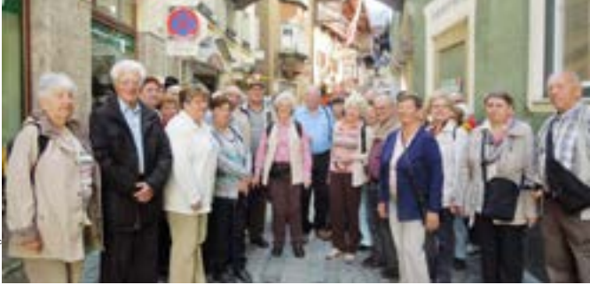
Besuch von Kufstein, in der Römerhofgasse.

Dienstag, 1. Juli: 15:00 Uhr: Treff mit Grillen im Garten des Siedlerheimes.