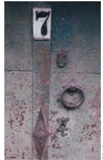
Detail der Türe von Keller Nr. 7

dieser Serie), ist die Kellernummer zu unterscheiden von der Hausnummer (Orientierungsnummer) und das gilt auch für unsere Kellergasse. Unterhalb dieser Nr. 7 ist auf der Schlagleiste ein Türbeschlag in Form einer künstlerisch gestalteten Raute angeordnet. Diese stellt ein altes Fruchtbarkeitssymbol dar und findet sich öfters auf Kellertüren. Schließlich ist noch ein Ring aus Messing vor-