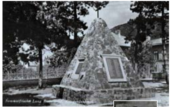
Kriegerdenkmal auf der Bergseite der Pfarrkirche St. Katharina, entworfen von Anton Hanak im Jahr 1922.

Im Jänner 1933 wurde Adolf Hitler in Deutschland zum Kanzler ernannt. Die damalige Schutzmacht für Österreich, das faschistische Italien unter Mussolini, dräng-