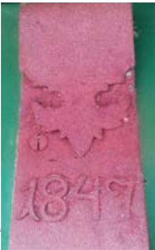
Detail der Türe Roessler-Keller mit Jahreszahl 1847

Von Interesse ist auch die Kellertüre. Deren Ausführung und Gestaltung richtet sich nach alten und erprobten Formen und Abmessungen und erfolgt meist zweiflügelig: Links der Stehflügel der oft als Gärgitter ausgebildet wird (zur guten Durchlüftung des Presshauses) und rechts der Gehflügel. Der Türspalt wird durch die Schlagleiste abgedeckt, welche meist aus einem kräftigen Bandeisen besteht und oft mit Verzierungen versehen wird.